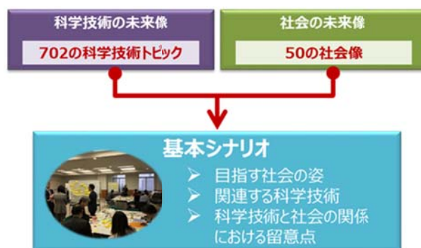
図表 a 基本シナリオの構成

科学技術・学術政策研究所（NISTEP）は、第6期科学技術基本計画を始めとする科学技術イノベーション政策・戦略の検討に資する基礎的な情報を提供することを目的とし、2017年から第11回科学技術予測調査を実施した。本検討では、これまでに得られた科学技術の未来像（702の科学技術トピック）と社会の未来像（50の社会像）を基に、①目指す社会の姿、②それに関連する科学技術、③科学技術と社会の関係における留意点を1つのパッケージとした「基本シナリオ」の枠組みを設定し、科学技術の発展が望ましい社会の実現に寄与する姿を生活者の視点から描くことを試みた（図表 a）。